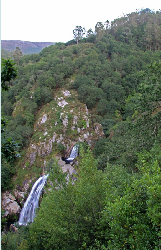
Canón do Belelle no Couce

Podemos chegar á ferverza por dous camiños. Desde Neda, na estrada de Ferrol ás Pontes collemos, na Mourela, un cruce á dereita que vai ao Roxal na parroquia de Anca (Neda), e no Roxal un desvío, tamén á dereita, ata o pazo de Isabel II. Desde o pazo séguese o camiño que remonta o río ata a central hidroeléctrica e desde ela por un carreiro chegamos á ferverza. E desde Fene subindo por Sillobre ao Marraxón, desde onde podemos gozar de vistas da ferverza desde o miradoiro, e baixar logo polo espazo acondicionado, que salva, con escaleiras e un carreiro, os 150 m de desnivel que nos separan da base da ferverza.