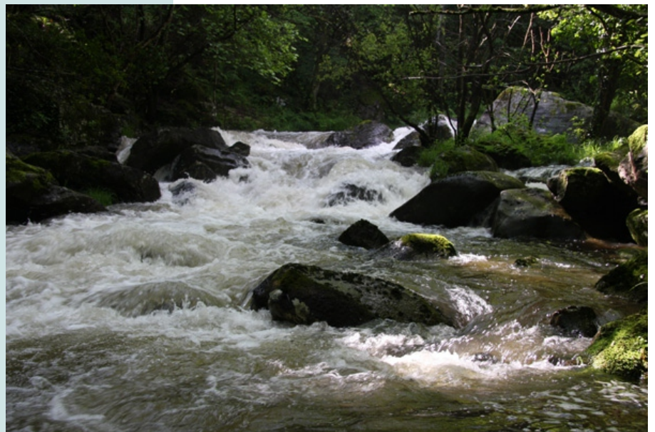
Río Beelle no Roxal (inverno)