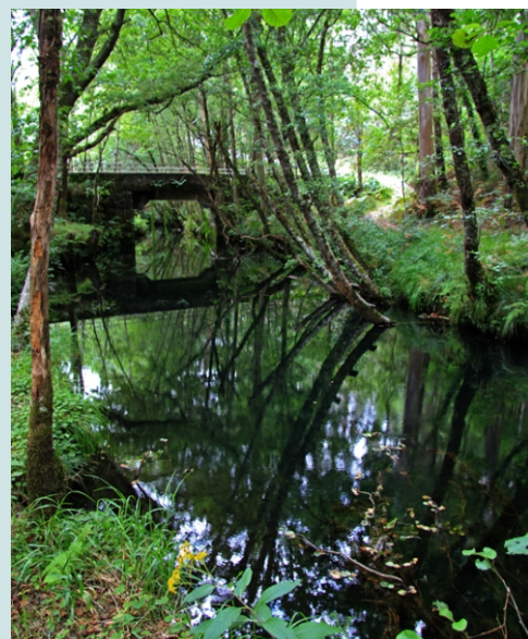
Ponte Grande de Formariz