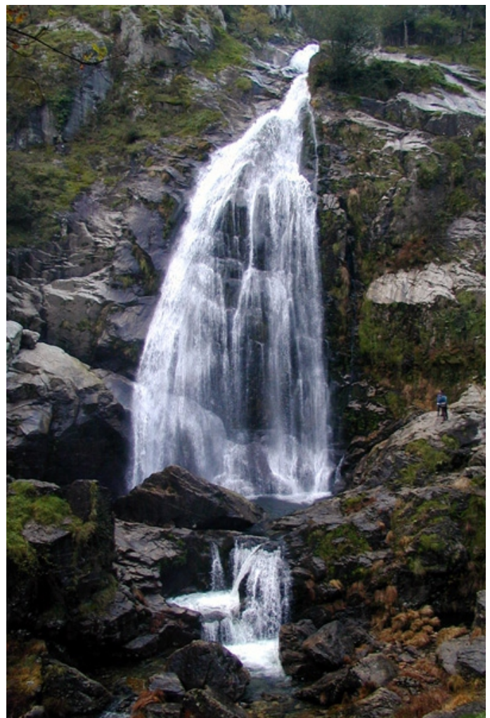
Ferverza do Marraxón