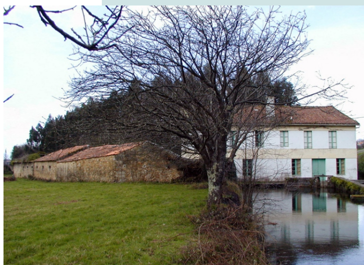
Muíño do Carrizo ou fábrica de papel da Mourela.