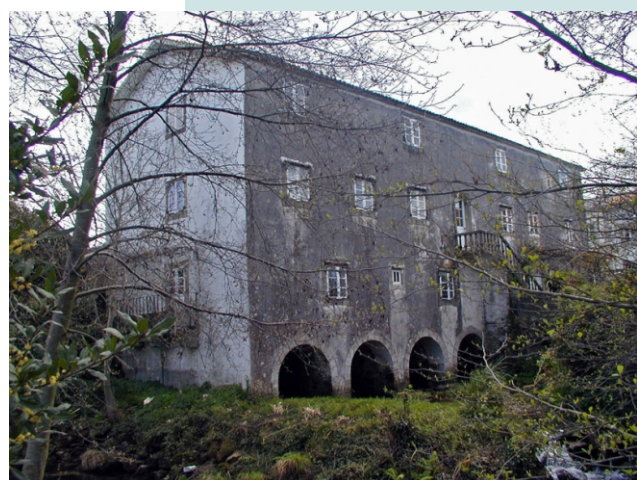
Muíño do Cubo, en Neda. Estivo activo ata 1976.