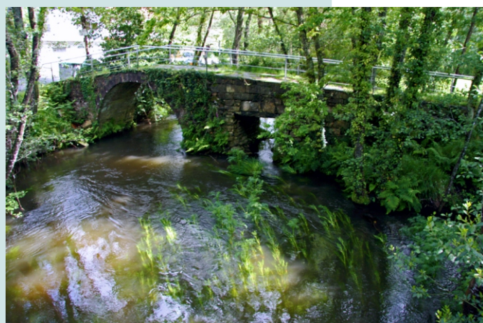
Ponte de Silobre