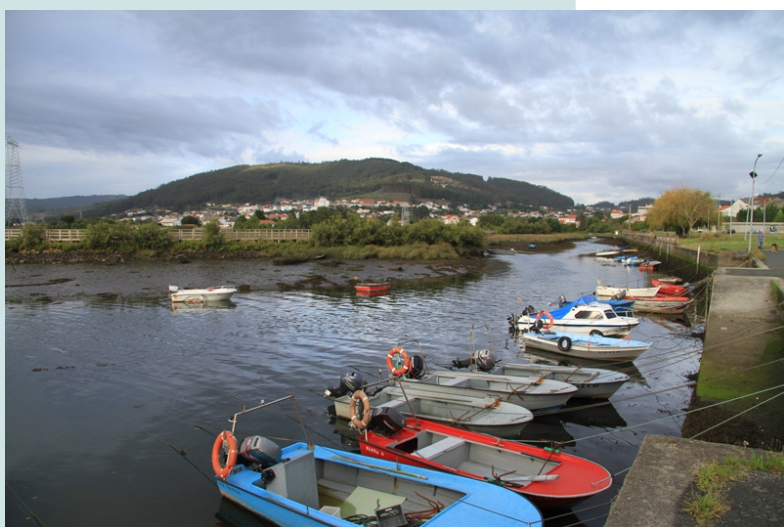
Esteiro do Bellelle en Neda.