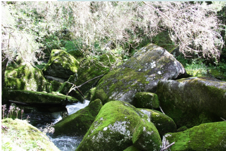
Riocuberto. O río desaparece entre os penedos que se acumularon por un antigo derrube.